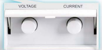
面板门盖翻盖效果