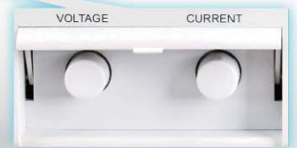
面板门盖翻盖效果